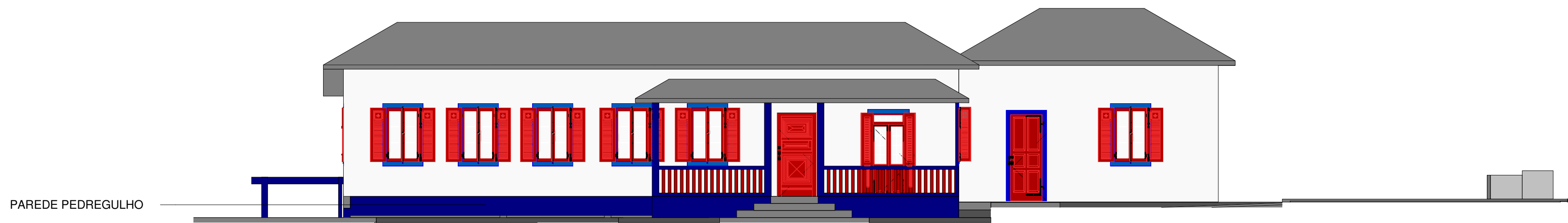
1 Frontal Cadastral 1 : 100