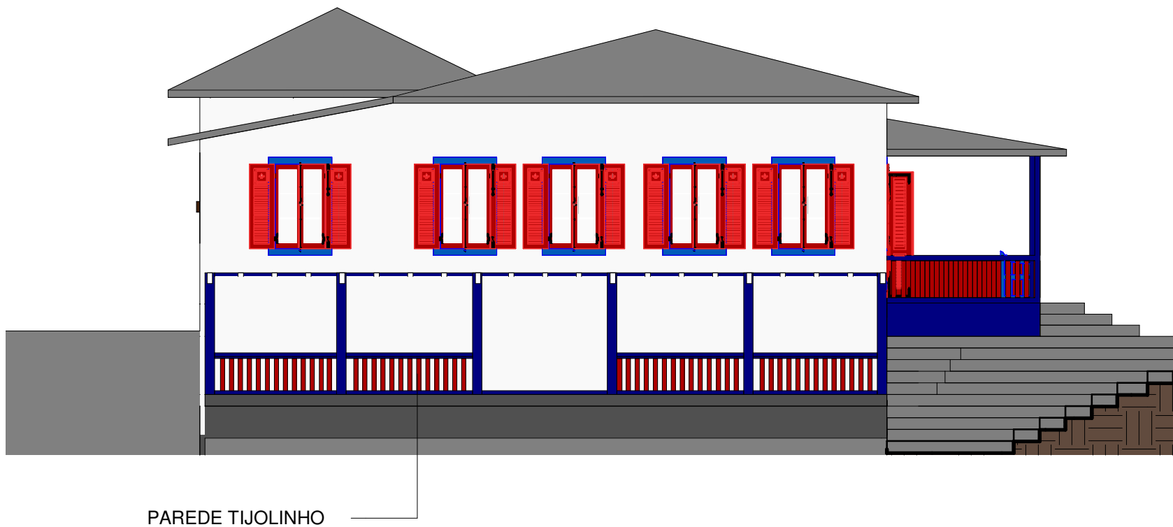
3 Lateral Esquerda Cadastral 1 : 100